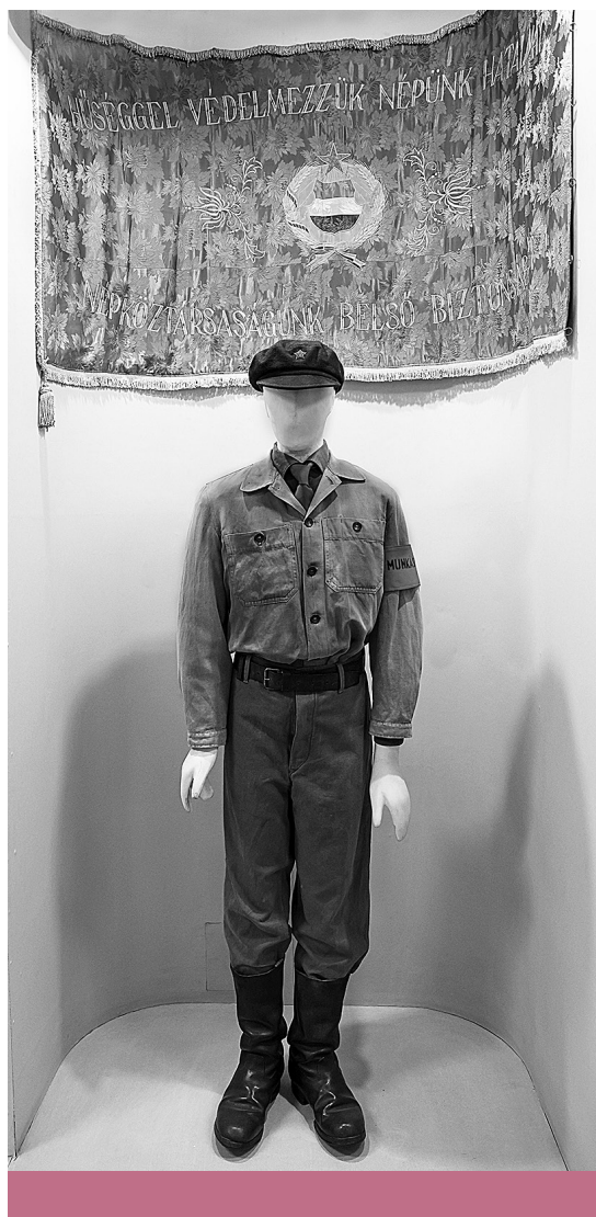
Muzeális darab – Részlet a dunaujvárosi Intercisa Múzeum állandó kiállításából 2022 tavaszán