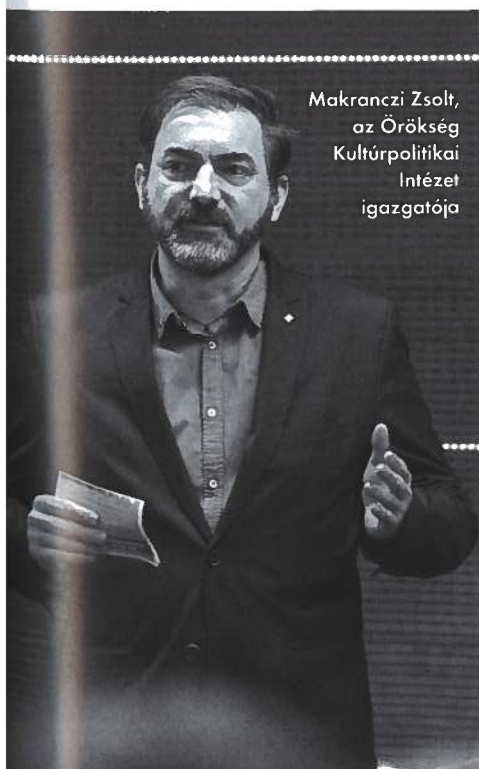
Makranczi Zsolt, az Örökség Kultúrpolitikai Intézet igazgatója