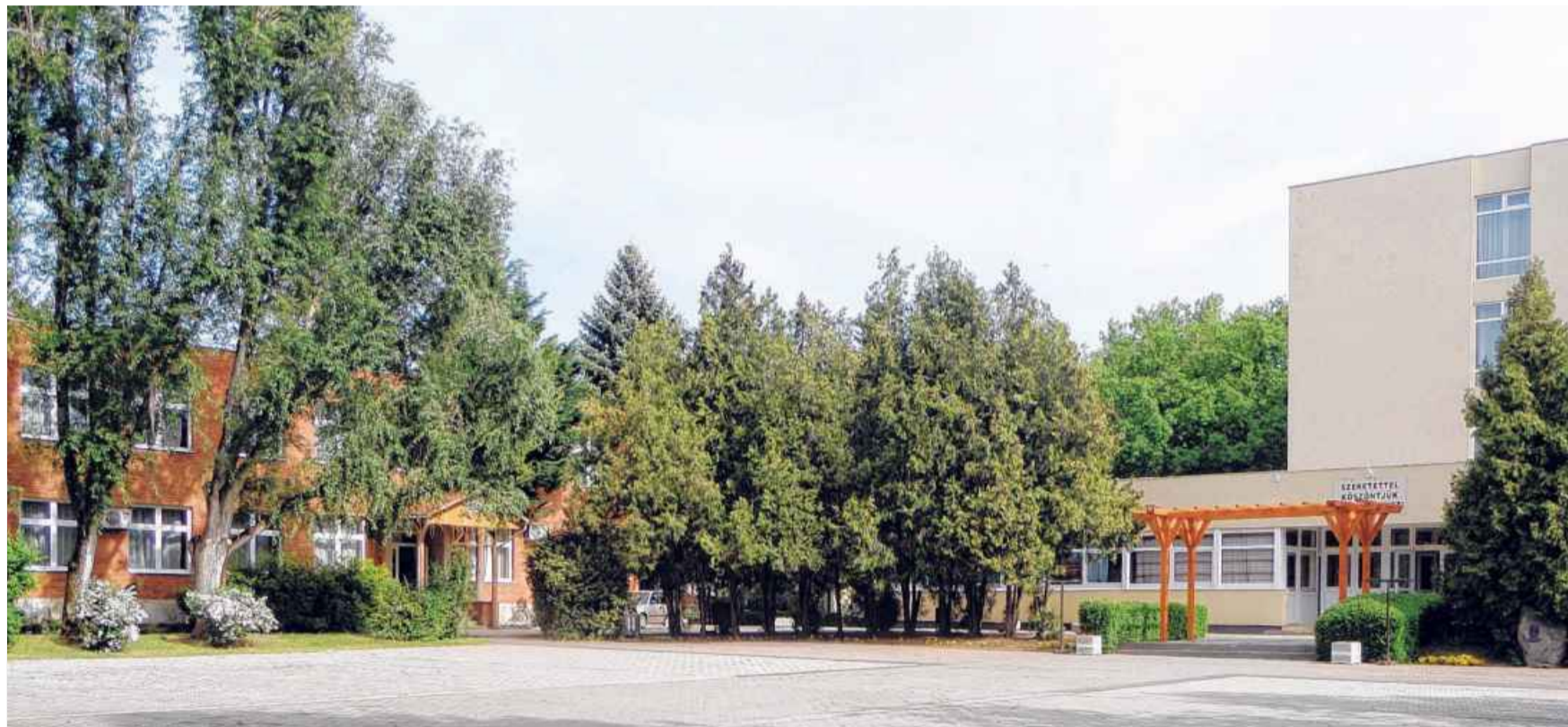
A jelenleg 13 nappali és három esti osztállyal működő intézmény korábban saját erőből igyekezett kialakítani új férőhelyeket, a minisztérium most 200 millióval segít

A fejlesztés azonban ezzel nem áll le, a kormány döntött – Európai Uniósi pályázati forrásból – az agrárszakképző iskolák energetikai megújításáról, amiből a kollégium és az iskolaépület teljes külső szigetelése mellett a nyílászárókat is tervezik kicserélni.