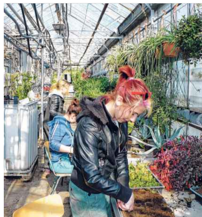
A nadapi úton található dísznövény-üvegházban, ahol a kertészek gyakorlati oktatása folyik, korszerű, klimatizált, számítógépes tápoldatvezérléssel ellátott öntözőrendszer működik

– A velencei kihelyezett szakág sportolói jelenleg iskolai tornatermekben edzenek, ahol a burkolat, illetve a palánk nem versenyekre,