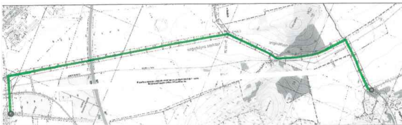
Kápolnásnyék és Pázmánd a két települést összekötő mezőgazdasági utakra nyújtott be pályázatot, a kivitelezés becsült költsége 300 millió forint. Az út hossza: 5,1 kilométer. Az útvonal: Kápolnásnyék belterületén, a Deák F. utca – Arany J. utca – Kutas sortól indul, folytatása Kápolnásnyék belterületi határától Pázmánd külterületéig tart. Az M7 autópályát a meglévő mezőgazdasági és gyalogos felüljárón átvezetve keresztezi

Pázmánd közötti határterészen meglévő földutak vegyes használatú aszfaltozási tervei. Ezek megépítése óriási turisztikai attrakciót jelentene, de ami legalább ennyire fontos, a környékbeli mezőgazdaság érdekeit is szolgálná. Velence és Gárdony esetében az sem lenne mellékes, hogy a Pusztaszabolcs felől Gárdonyba jövő forgalom egy részét is elvezetné, így a 7-es út terhelése csökkenne, ami a nyári dugók esetében különösen indokolt lenne.