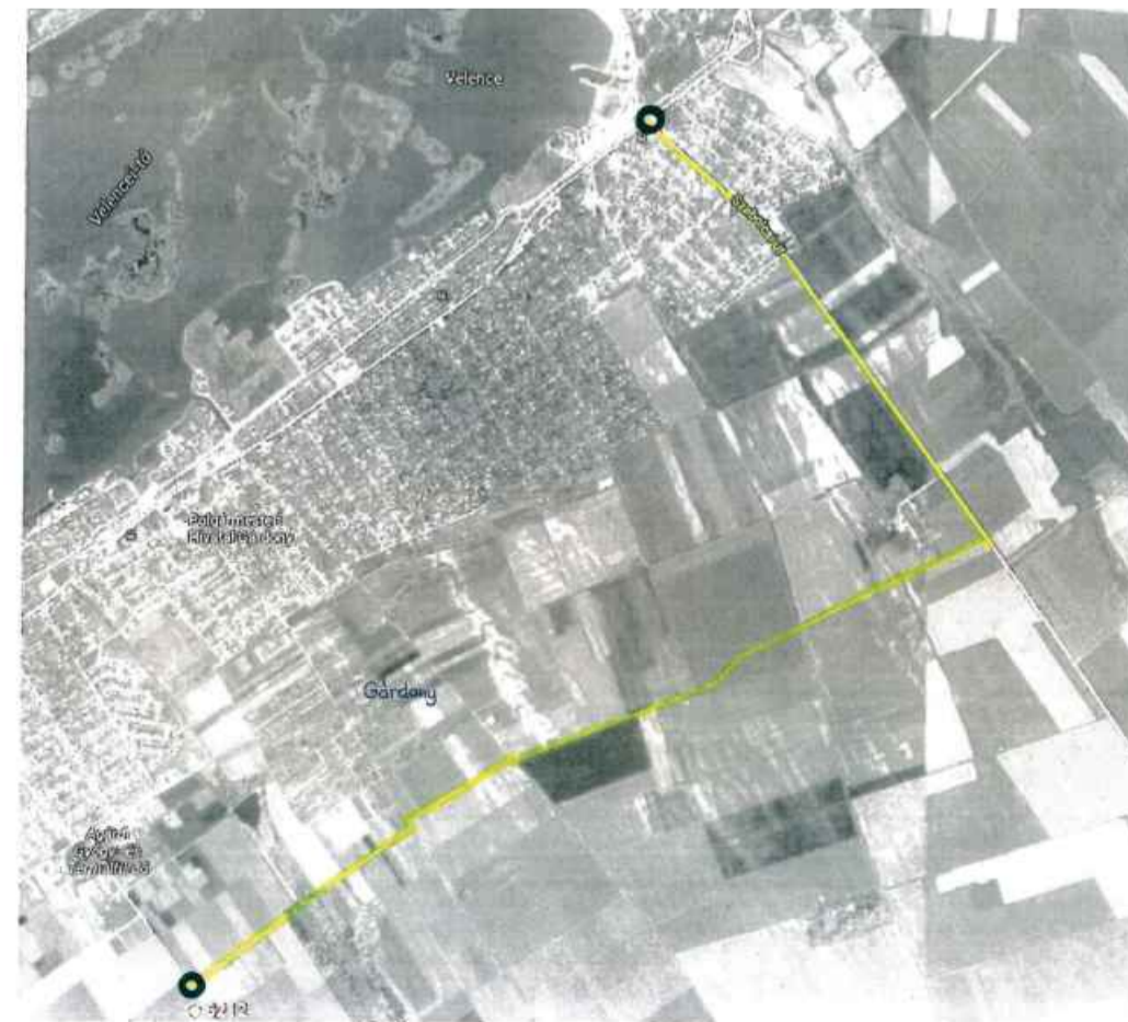
Gárdony polgármestere hasonló érvekkel utasította el az ajánlatot, s ezzel azt is ellehetlenítette, hogy Velence beadja a Gárdony felé tartó határbeli út pályázatát, mivel a kettőnek össze kellett volna érnie