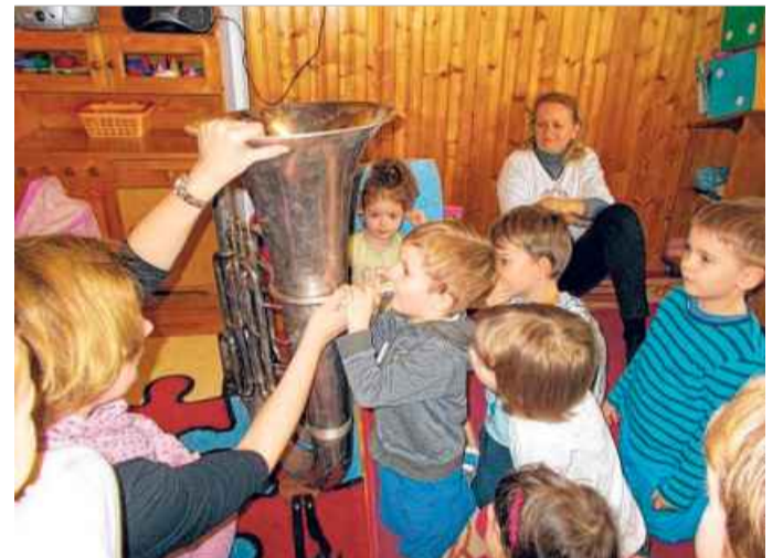
A gyerekek református szellemiségben nevelkednek, a férőhely azonban kevés, így teljes gőzzel azon dolgoznak, hogy pályázati úton új óvodát építhessenek

– Ez a mi Manó kertünk, amellyel a kicsik földhöz, szülőföldhöz való kapcsolatát is szeretnénk erősíteni. Nagy hangsúlyt fektetünk a tehetséggondozásra, ezért szoros együttműködésben dolgozunk a székesfehérvári Csitáry