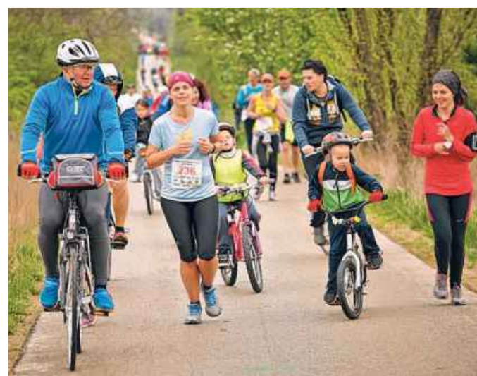
Tizedszer hívják, várják a futás szerelmeseit a Velencei-tó partjára

A borítékolt még nem történt meg, a bizottság március elején kezd meg munkáját és legkésőbb március 12-ig hirdetnek eredményt.