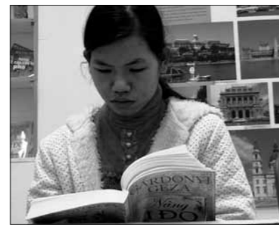
Egy hanoi diák az Egri csillagok vietnami kiadását forgatja

A nagy nemzetközi konferenciák előtt álló feladat, hogy a résztvevők sokféle igényének megfelelő programot szervezzenek. A vendégek szándéka azonban nem szükségszerűen azonos a vendéglátóéval. A vietnami írószervezet célja az volt, hogy a vietnami kultúrát nyitottnak, párbeszédet kezdeményezőnek mutassa be. Ezért történhetett, hogy a gasztronómiától a táncig, az életmódtól a turisztikai látványokig annyi területen izgalmas élménnyel gazdagodtam, de a konkrét ütemtervek nem kerültek napirendre. Pozitívum, hogy aláírtam a Vietnami Írószövetség elnökével egy ötéves együttműködési keretszerződést, ami mérföldkő a két szervezet történetében, ám csak akkor van értelme, ha tar-