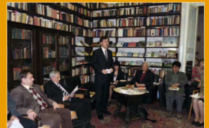
Csung-Ha Szuh, a Koreai Köztársaság magyarországi nagykövete köszönti az irodalmi est résztvevőit

2010. június 8-án a Magyar Írószövetség Íróiskolája végzős hallgatói átvették oklevelüket az évváró irodalmi estjükön.