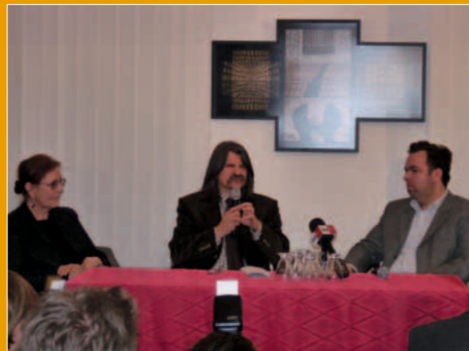
2010. február 18. Radikalizmus Magyarországon. Vendégünk: Kövér László.