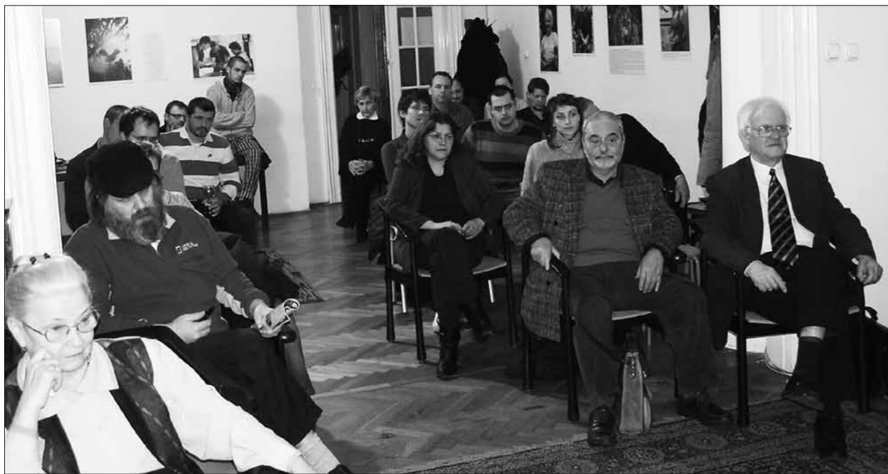
A konferencia közönsége