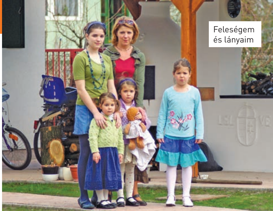
Feleségem és lányaim

Aztán mint választott megyei önkormányzati képviselő kapcsolódott be a közéletbe.