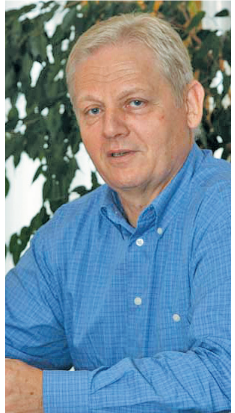
TARLÓS ISTVÁN várospolitikus, a fővárosi Fidesz-KDNP frakciósövetség elnöke

Örülök, hogy az unokám képviselő lesz. Meg vagyok győződve arról, hogy a Nemzet javát fogja szolgálni. Bízom benne, tudom, hogy az embertársaiért fog cselekedni. Boldog az az ember, aki nem önmagáért, hanem a felebarátaiért él és dolgozik.