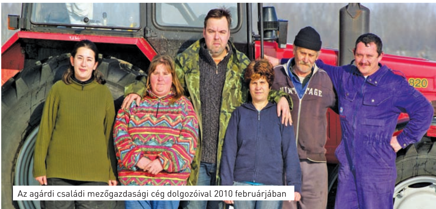
Az agárdi családi mezőgazdasági cég dolgozóival 2010 februárjában

– Nagy eredmények tartom, hogy létrehoztuk a szakképző iskolák bevonásával a Térségi Integrált Szakképző Központot, amelynek aztán uniós forrásból származó fejlesztési pénzeket is nyertünk. A legnehezebb feladat a megyei közgyűlésben: küzdeni a kormányzati megszorítások hatásai ellen, azaz megmenteni az intézményeinket. A mai időkben, sajnos, már az is eredménynek számít, hogy mi megőriztük valamennyi közművelődési intézményünk önállóságát, s a legtöbb megyével szemben a megyei művelődési központunk is talpon tudott maradni. Az Oktatási és a Kulturális Bizottság, valamint a Dunaújvárossal kö-