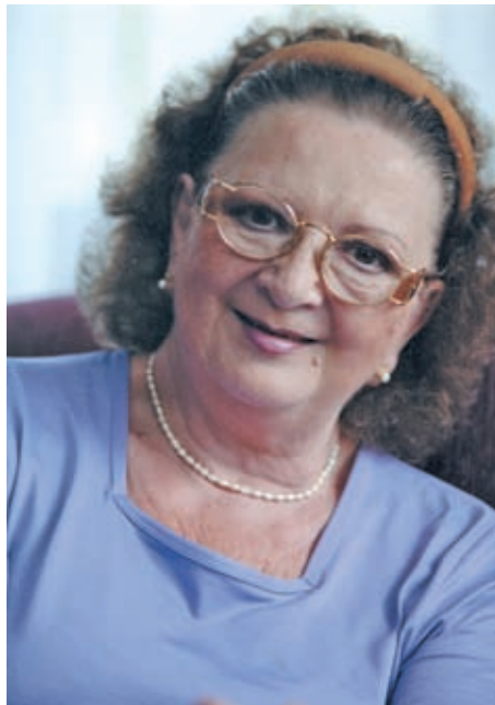
JÓKAI ANNA Kossuth-díjas író

A magyar történelemben a költők mindig kiemelt szerepet játszottak, lelkiismeretünk, nemzeti öntudatunk, szabadságföltésünk őrzői. L. Simon László nemcsak kiváló barát, kiváló költő, de a közösségéért dolgozó kiváló politikus is.